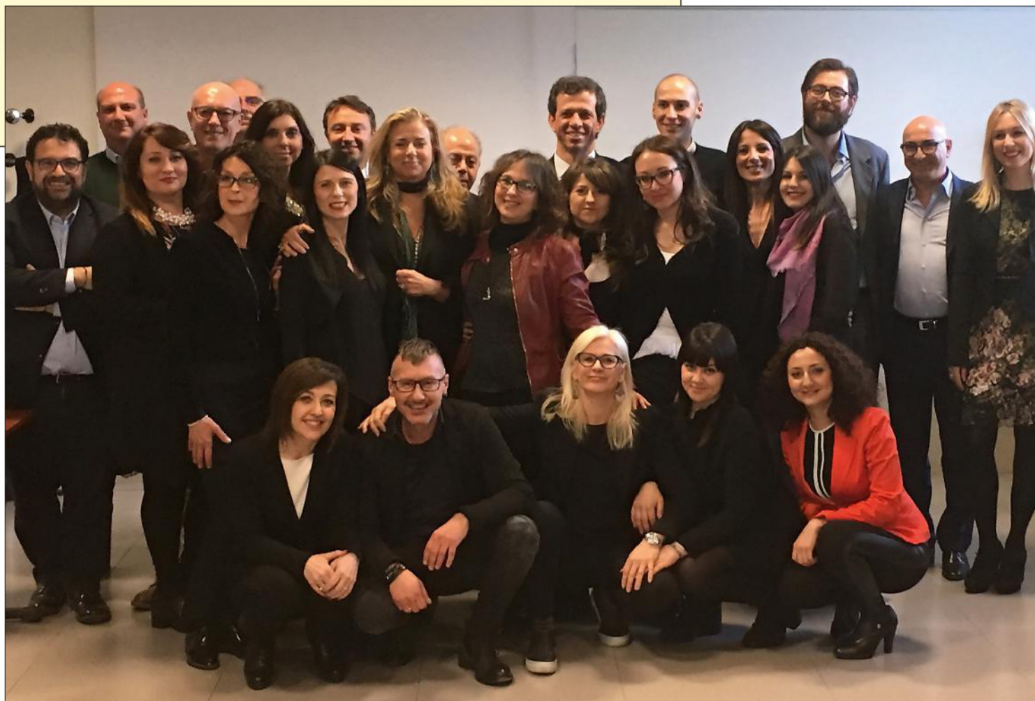
FOTO DI GRUPPO CON I 15 PARTECIPANTI AL CORSO, I PROFUMIERI, I RAPPRESENTANTI DELL'INDUSTRIA, IL PRESIDENTE E IL SEGRETARIO FENAPRO E I RAPPRESENTANTI DI SHACKLETON.