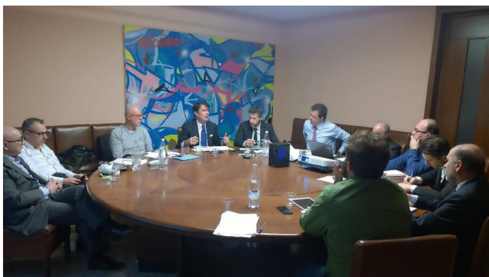
UN MOMENTO DELLA RIUNIONE IN CUI SONO STATE GETTATE LE BASI PER LA REALIZZAZIONE DEL PROGETTO.

Profumeria, l'ipotesi che, al momento, trova tutti d'accordo, è quella di regalargli, a fronte di una spesa minima che potrebbe attestarsi attorno ai 30/35 euro, un kit di bellezza, contenente minitaglie di prodotto da stagionalizzare e collegare ai singoli eventi programmati con l'industria. Sarà il personale di vendita a comporre il kit con le minitaglie delle aziende di cui è concessionario e che sono anche sponsor dell'evento.